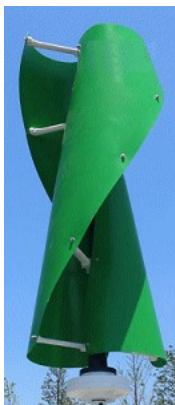
Cette éolienne de 1 kW, de type Helix, dont le but est essentiellement pédagogique, sera fixée prochainement.

Un premier cours et le début de la construction de la centrale électro-solaire ont eu lieu en mai dernier. Malheureusement, les batteries n'avaient