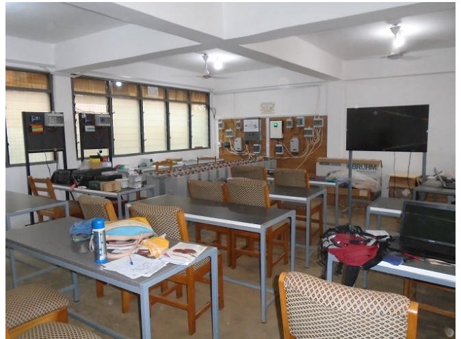
La première salle de cours de l'Institut avec au fond la centrale électro-solaire et ses batteries, deux centrales solaires domestiques pédagogiques et un petit laboratoire d'électricité de base.